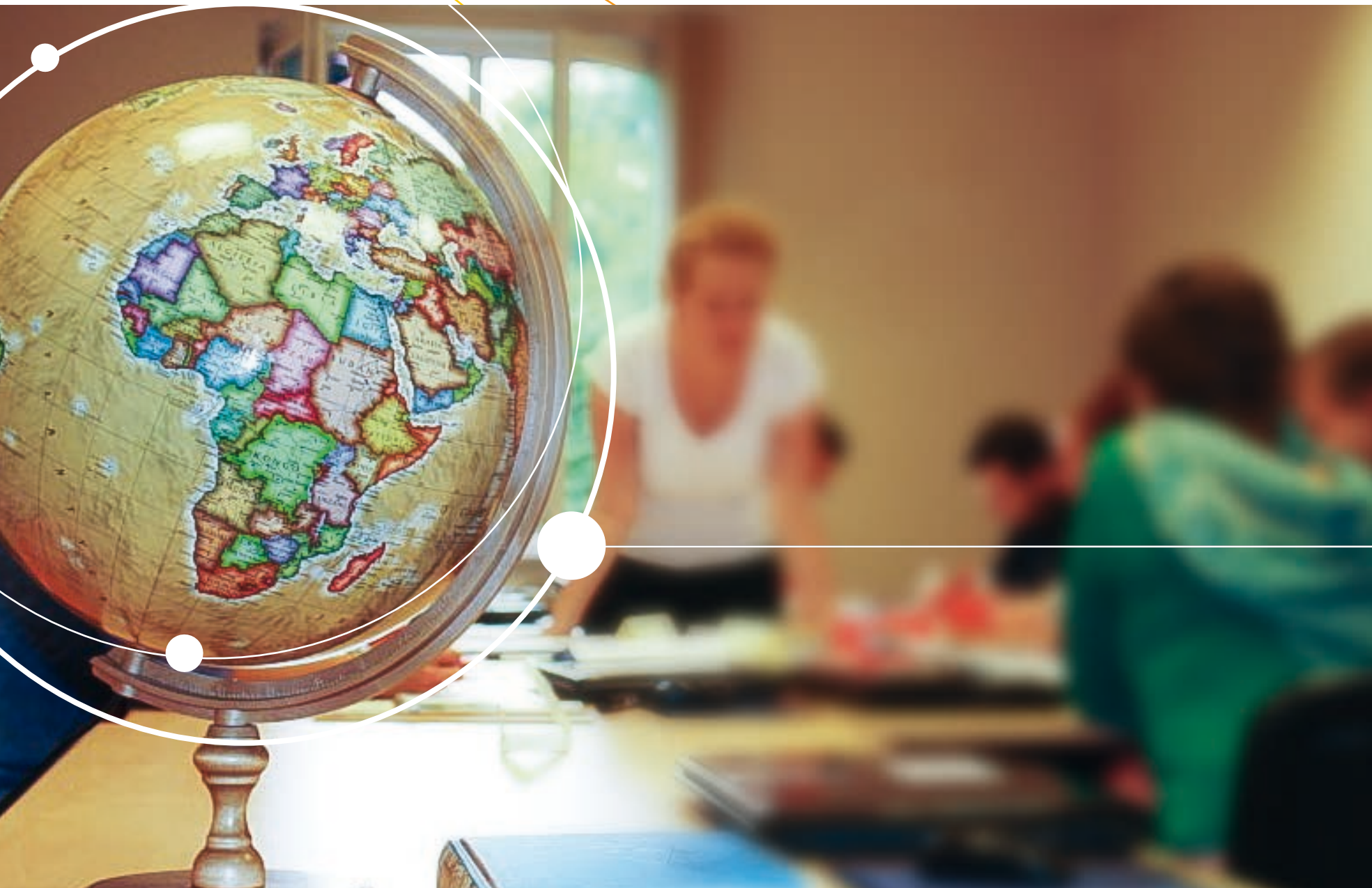
Spotkanie dotyczące edukacji globalnej. Kraków, Polska.