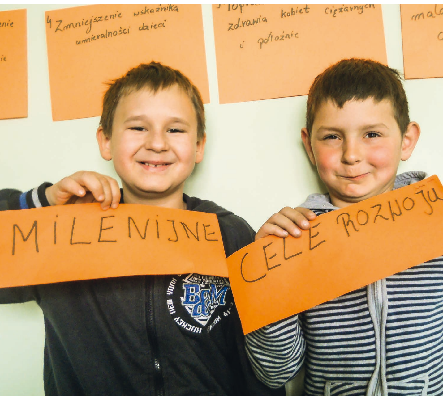
Zajęcia z zakresu edukacji globalnej w lokalnej świetlicy w Oświęcimiu. Polska.

Opierając się na szerokiej współpracy międzynarodowej, do roku 2020 chcemy, by Fundacja Dzieła Kolpinga w Polsce stała się liderem: