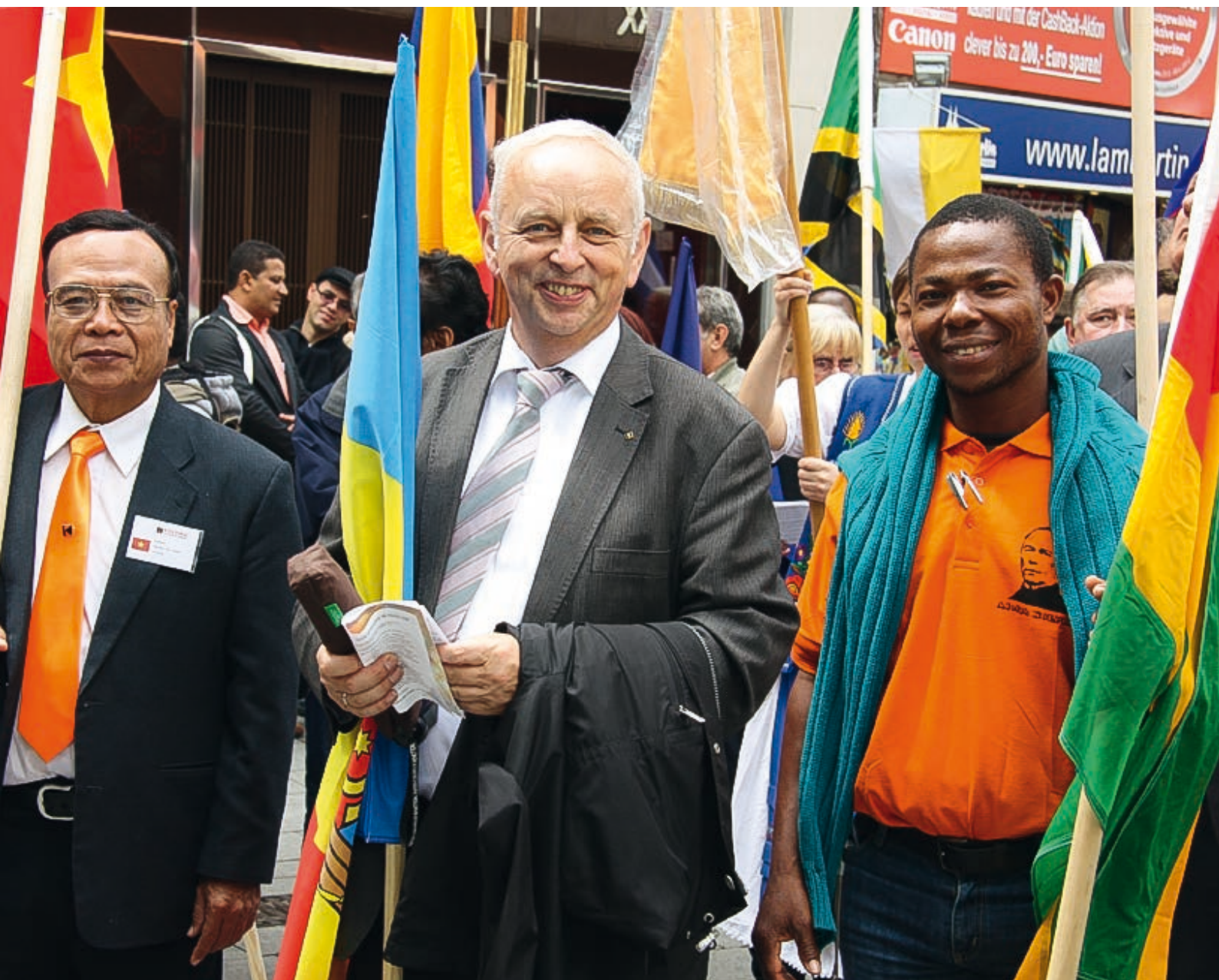
Zebranie Rady Generalnej Międzynarodowego Dzieła Kolpinga, Kolonia, Niemcy.