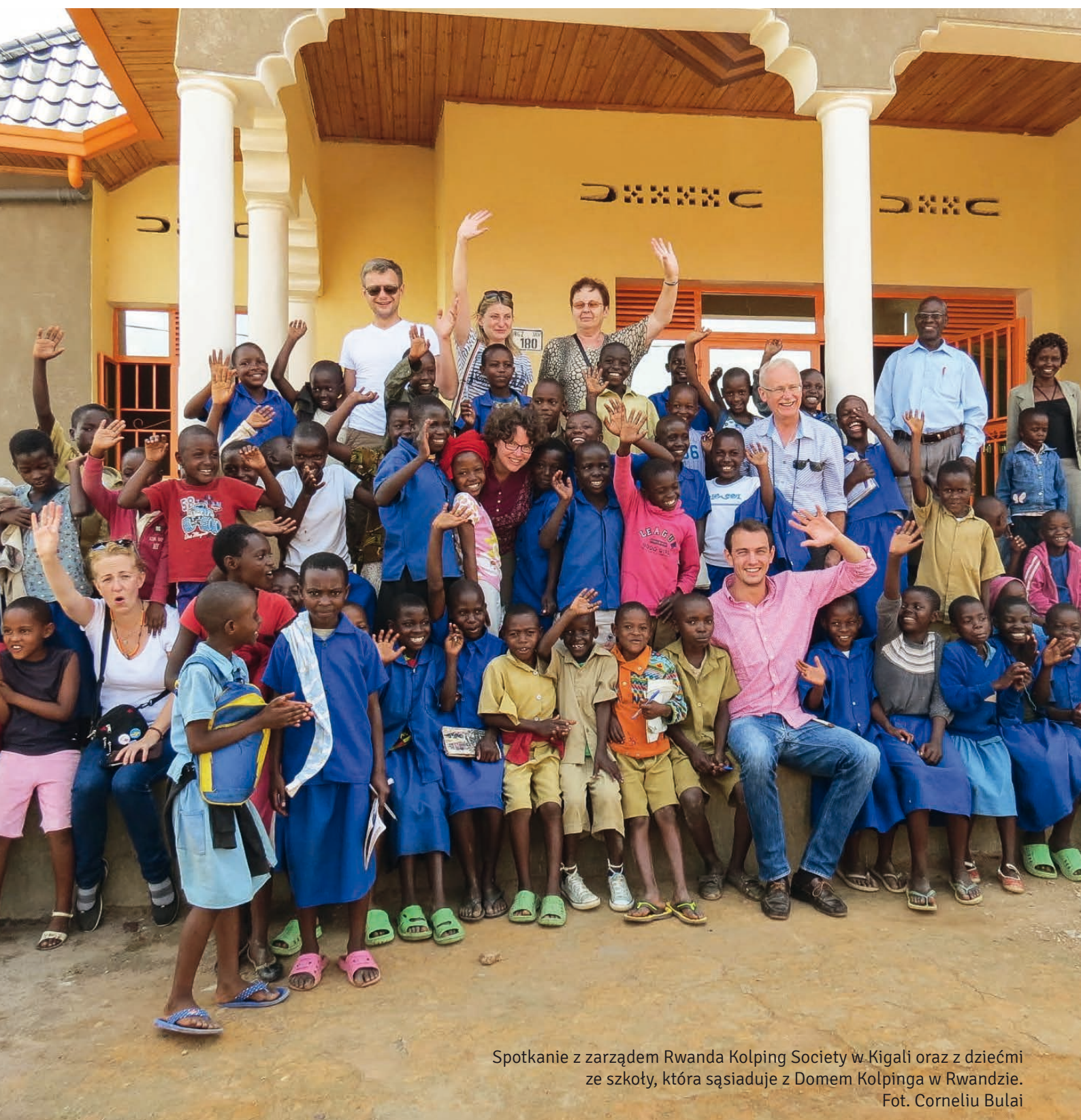
Spotkanie z zarządem Rwanda Kolping Society w Kigali oraz z dziećmi ze szkoły, która sąsiaduje z Domem Kolpinga w Rwandzie.