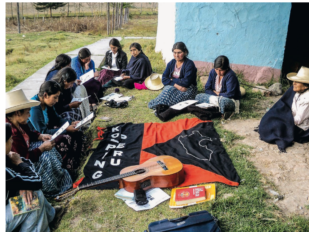
Przedstawiciele Dzieła Kolpinga z Peru.

Dobre relacje i pełne zaangażowanie pozwolą z sukcesem realizować wspólne przedsięwzięcia.