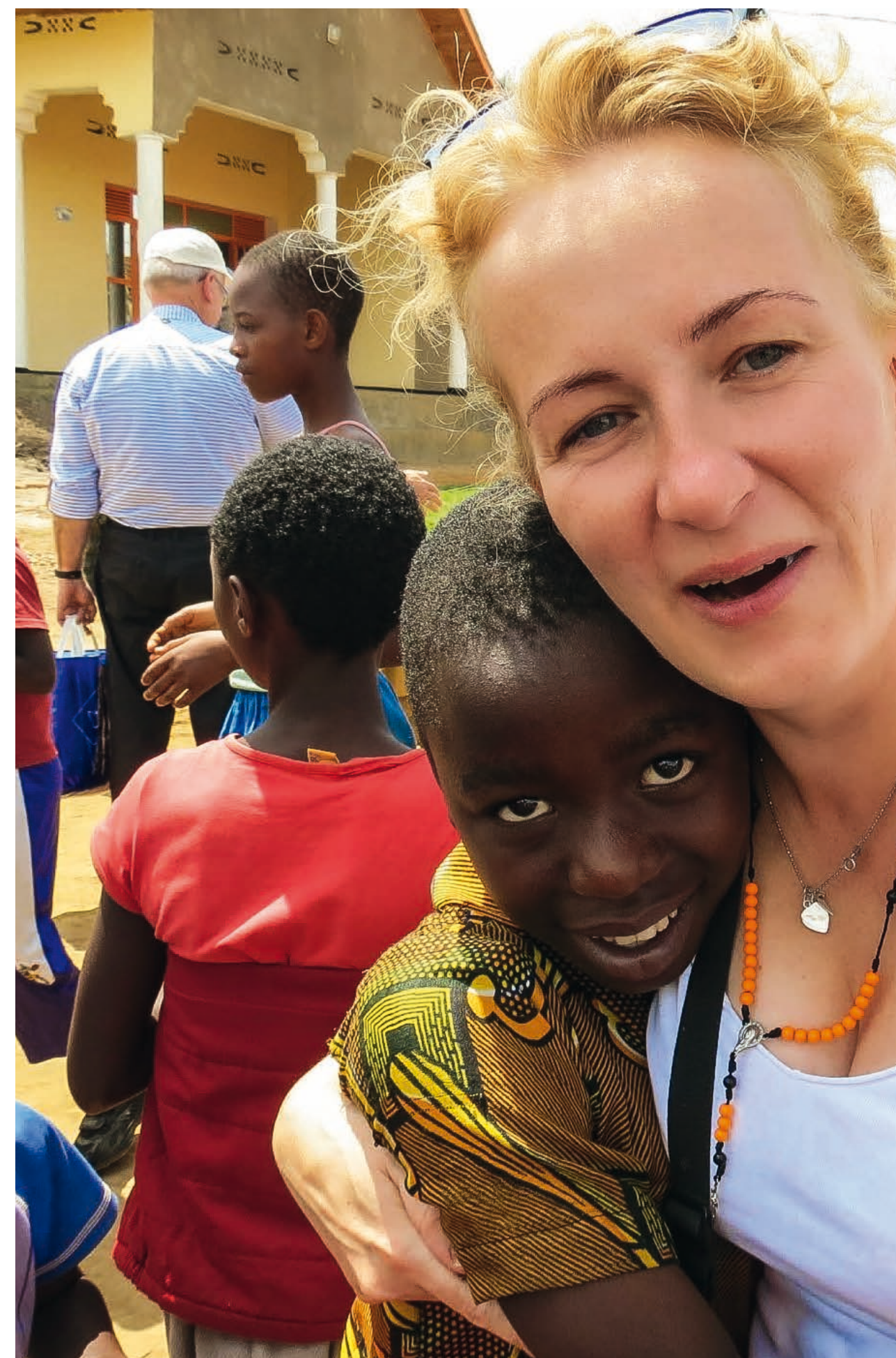
Spotkanie z dziećmi ze szkoły w Kigali, która sąsiaduje z Domem Kolpinga w Rwandzie.