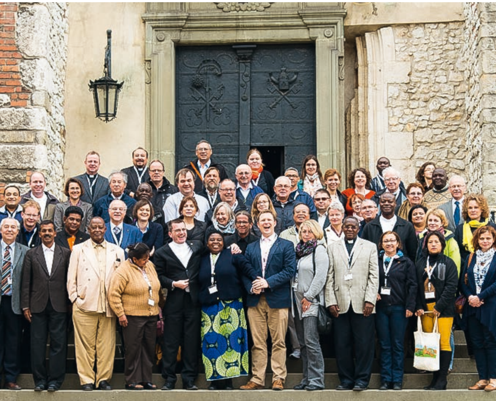
Spotkanie Rady Generalnej Międzynarodowego Dzieła Kolpinga. Kraków, Polska.

Całościowa realizacja wizji, misji i celów Fundacji Dzieła Kolpinga w Polsce przez społeczność kolpingowską odbywać się będzie w zgodzie z duchowością kolpingowską, która wyrasta z ogólnej myśli chrześcijańskiej i zainteresowania człowiekiem oraz współczesnymi problemami i wyzwaniem społecznymi.