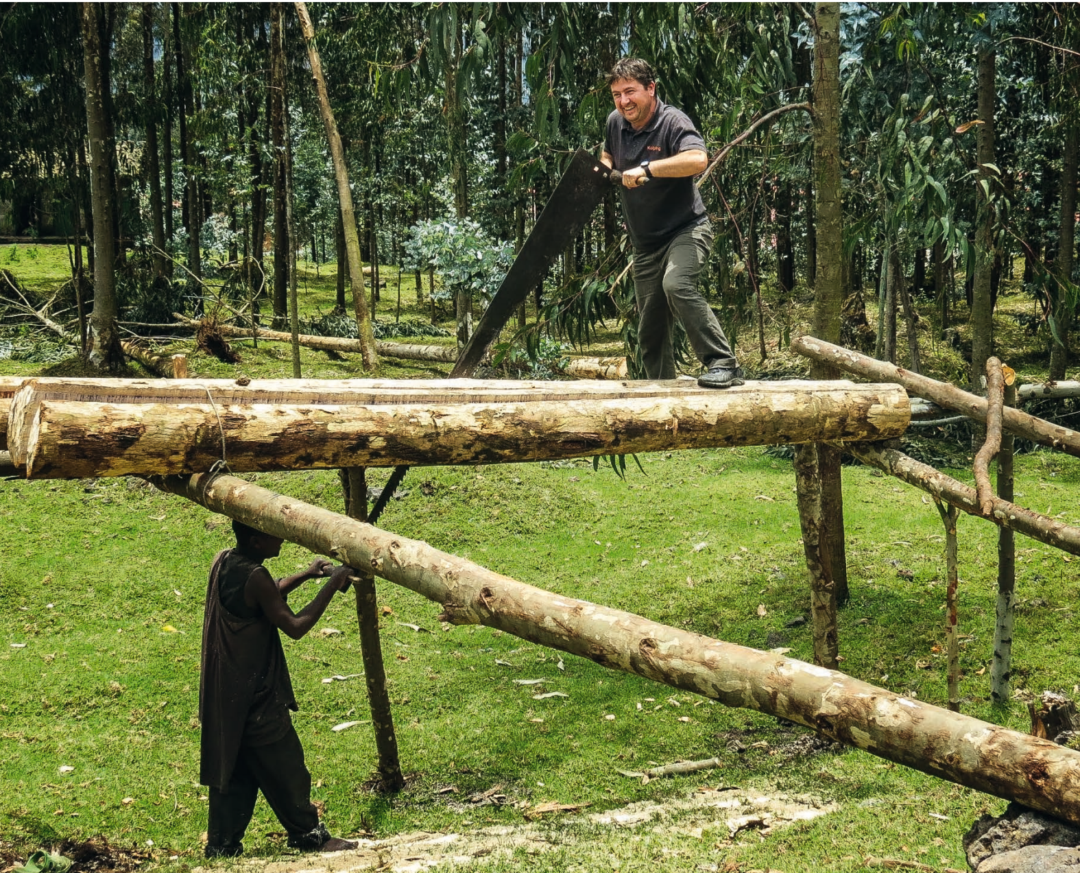
Spotkanie z przedstawicielami Dzieła Kolpinga w Busogo w Rwandzie.