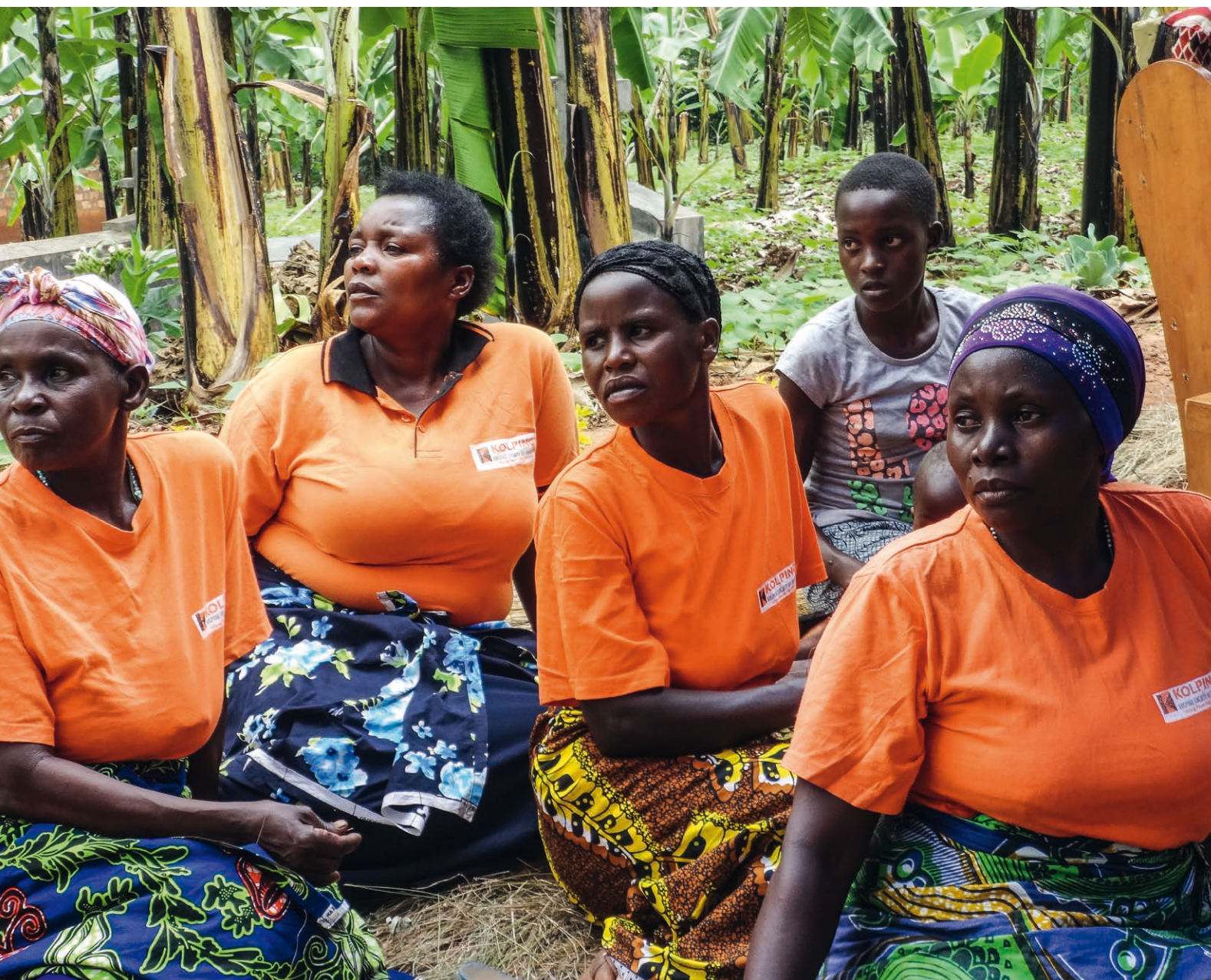
Członkinie Rodziny Kolpinga z wioski Mikoni w Tanzanii.

W celu wdrożenia strategii oraz realizacji misji i wizji sformułowane zostały cele strategiczne określające działania Fundacji do końca 2020 r.